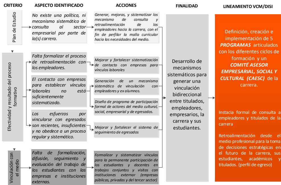
Figura 1. Lineamientos para la Vinculación con el Medio Carrera Diseño Industrial

Orientaciones que se muestran en la figura 1, a continuación: